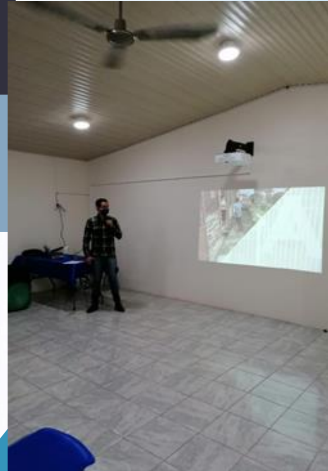
Presentación de informe "Rendición de cuentas: Proyecto Mejoras a las Redes de distribución Hatillo 1 y 2"